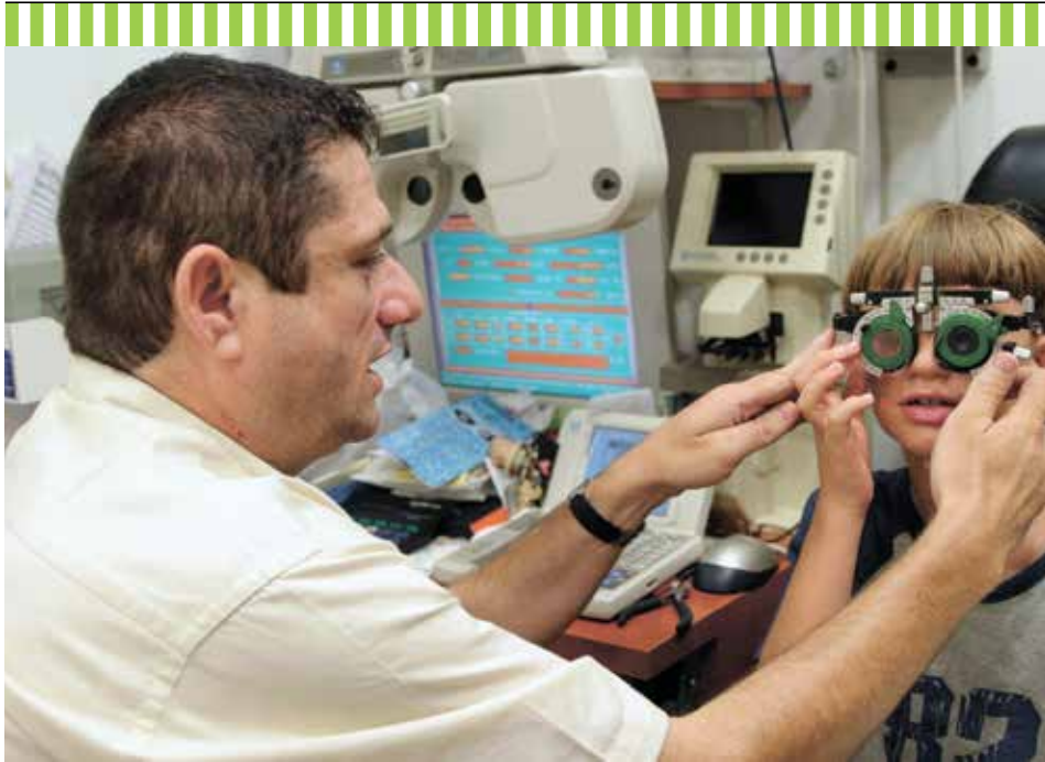
בדיקת ראייה. משקפיים אינם כלולים בסל הבריאות (למצולמים אין קשר לכתבה)